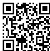
Odstavná plocha VT Jince